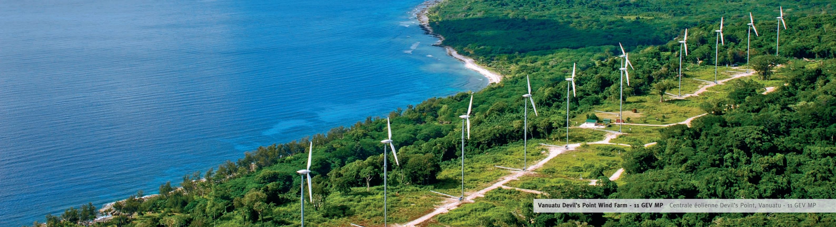
Vanuatu Devil's Point Wind Farm - 11 GEV MP Centrale éolienne Devil's Point, Vanuatu - 11 GEV MP